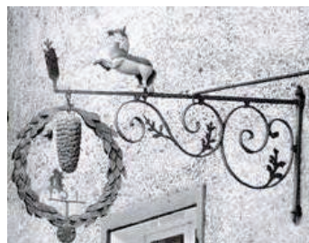
Das Gasthaus zum „Weißen Rössl“, besser bekannt unter „Besn“, hatte seinen Standort, wo sich heute der T&G in der Innsbrucker Straße befindet.

und in Stücke zerrissen. Wie geschah das Unglück? In den Felswänden beim so genannten „Finstertal“, einer zwischen der Martinswand und der Kranebitterklamm hinanziehenden Schlucht, mussten Sprengungsarbeiten vorgenommen werden. Durch das Regenwetter der letzten Tage war das Dynamit „angezogen“ (feucht) geworden. Vier bei der Sprengung beschäftigte Arbeiter begaben sich in eine an einer Felswand im Finstertal angebaute Unterstandshütte, um das Dynamit zu trocknen. Sie gaben fünf Kilo von dem furchtbaren Sprengstoff in eine Pfanne