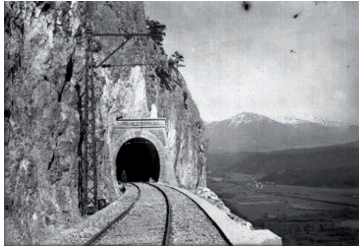
„Tunnel an der Wand Nr. II“ ist ober dem Portal zu lesen. Das kleine „Dörf“ Völs ist unten im Inntal zu sehen. Die Innauen sind noch nicht zur Gänze gerodet.

Sie wurden durch eine Dynamitexplosion in die Luft geschleudert