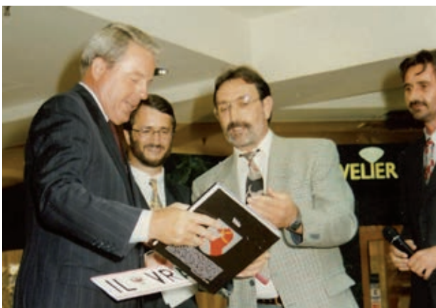
Übergabe des Völser Dorfbuches an Bundeskanzler Franz Vranitzky 1994