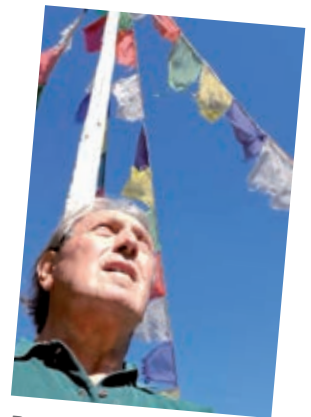
Porträt vor Fahnen bei der Wanderung 2020 in Kleintibet