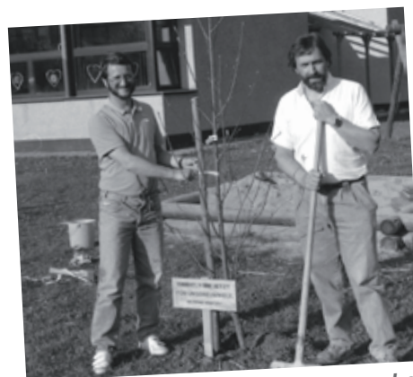
Pflanzung eines Maulbeerbaumes bei der Hauptschule 1990