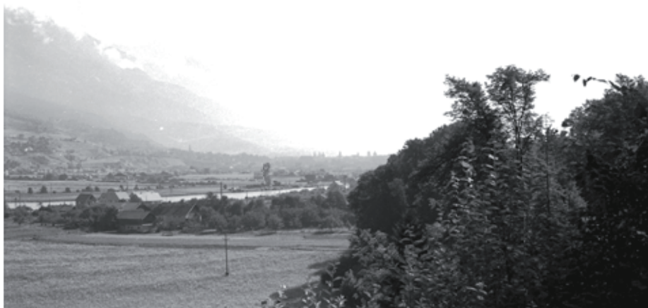
Die „untere Figge“ mit den zwei Bauernhöfen war bis Mitte des 20. Jh. ein idyllischer Flecken am Rande der Stadt.