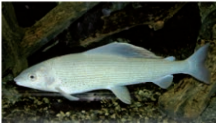
Zahlreiche Äschen hatten ihren Laichplatz früher im Gewässer des Völser Gießens.

bis feinsandigen, jedoch nicht felsigen Grund, bedarf ausgesprochener Reinheit des Wassers, um sich wohl zu fühlen, und leidet ganz besonders schwer unter industriellen oder anderen durch den Menschen hervorgerufenen Verunreinigungen ihres Wohngewässers, wird schon in der Forst- und Jagd-Zeitung vom 5. Jänner 1923 festgestellt.