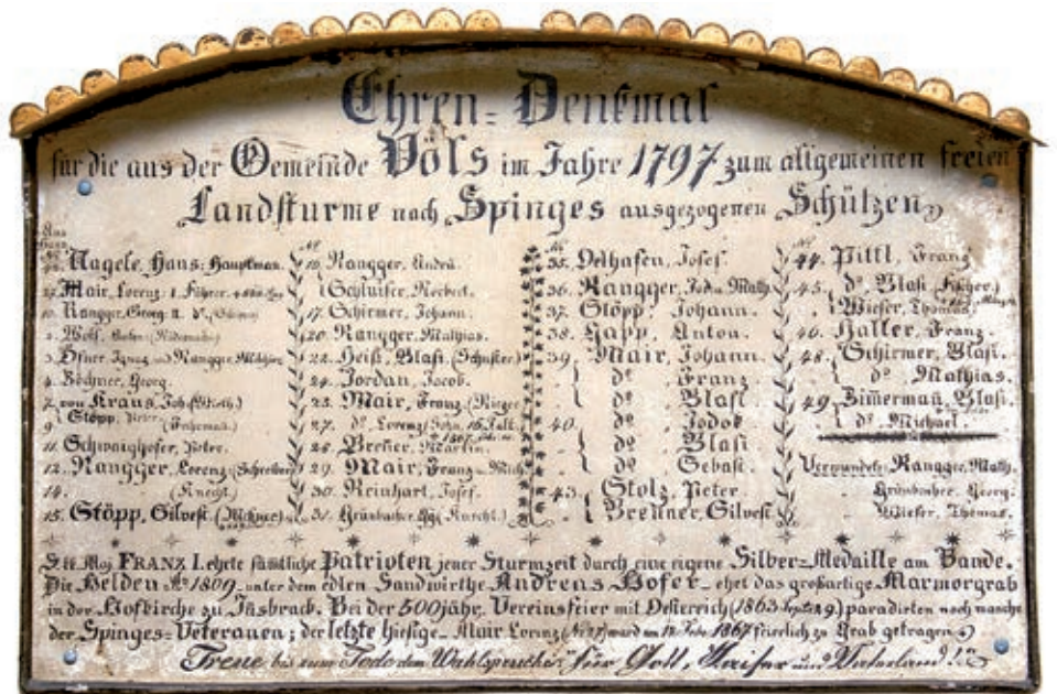
Auf einer Ehrentafel in der alten Völser Kirche sind die Spingeskämpfer angeführt, darunter unter der Hausnummer 45 Blasi Pittl, der „Fischer“.